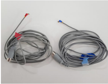
CS 44 케이블